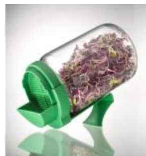
GERMOIR BOCAL EN VERRE